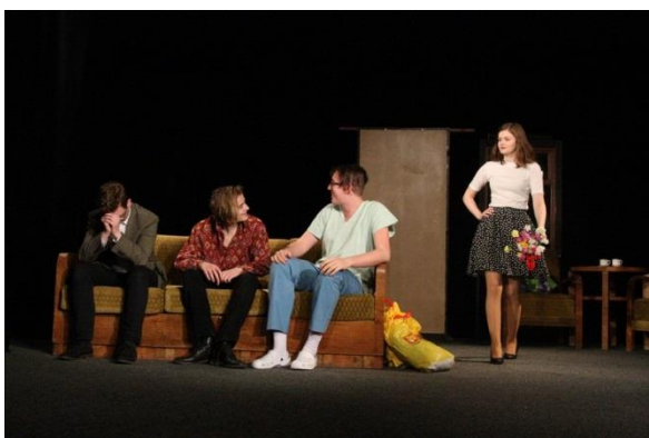
A je to v pytli