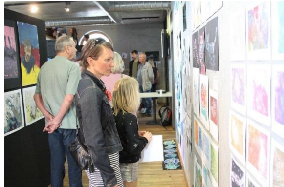
Cesty – vernisáž