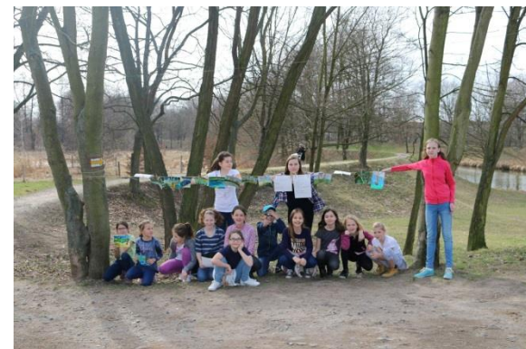
Galerie na cestě