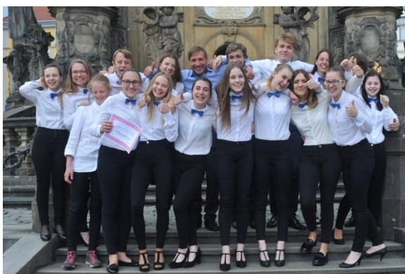
Smiling String Orchestra – absolutní vítěz ČR