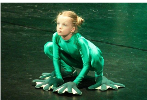
Tajemství staré skříně – závěrečné představení