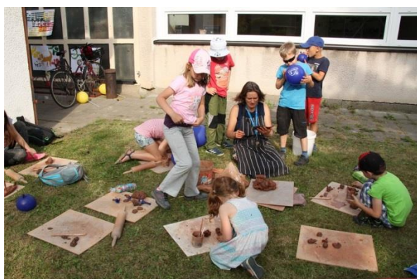
Open Garden 2018