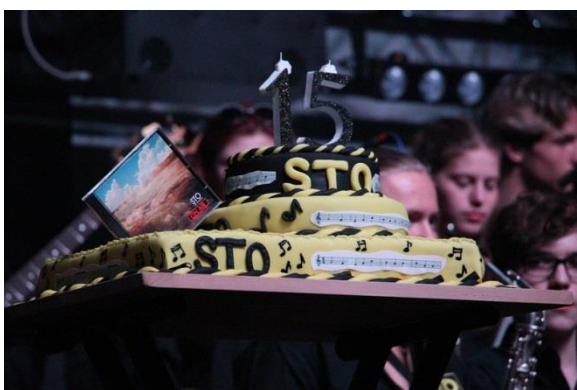
STO-HK slavil 15 let