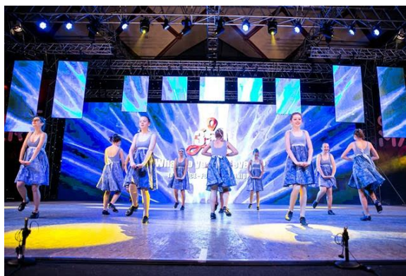
Stepaři – Mistrovství České republiky