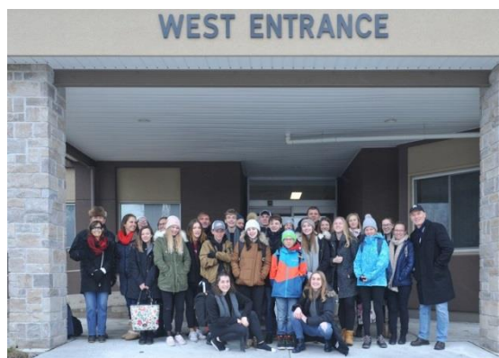
Smiling String Orchestra v Kanadě a USA