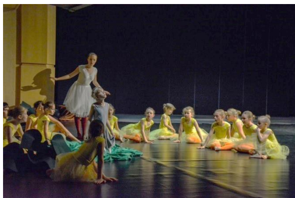
Závěrečné představení Ošklivé káčátko