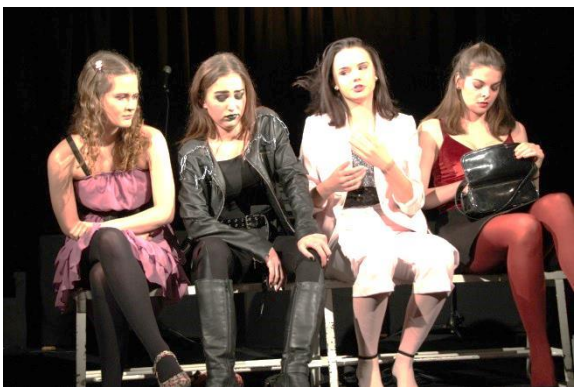
We are the talents