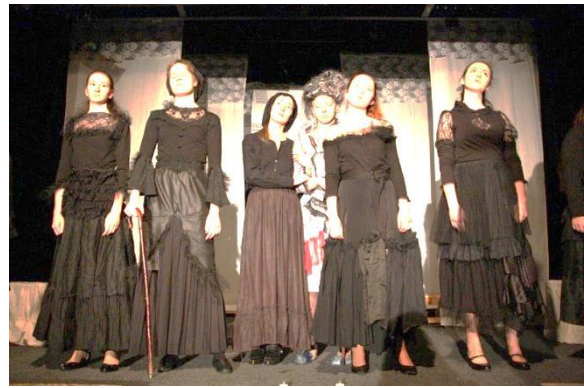
Dům Bernardy Alby