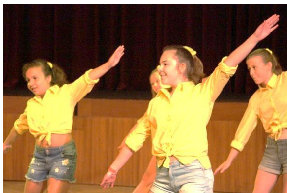
Závěrečné stepařské vystoupení