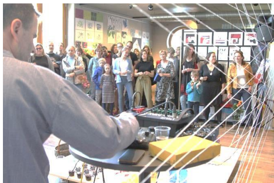
Vernisáž výstavy VO Síť