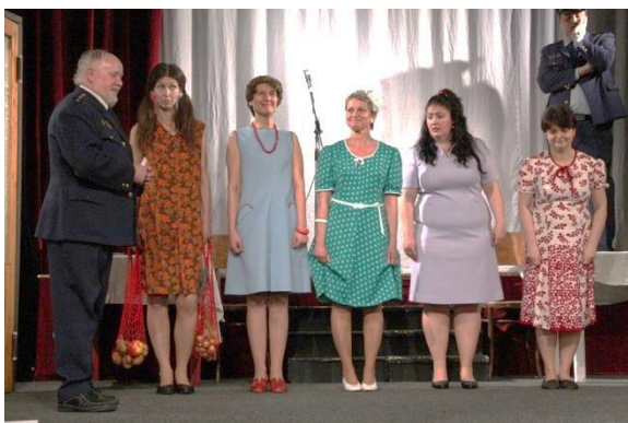
Hoří má panenko