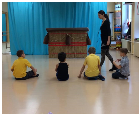
Představení doplňuje i projekce, která se musí natočit i zpracovat.