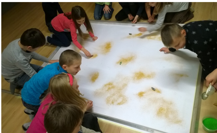
Děti workshop v Divadle Drak opravdu bavilo a dozvěděly se hodně nových věcí.