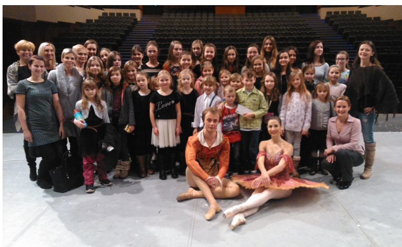
Pro děti byl výlet velkým zážitkem a mají na něj krásnou památku.