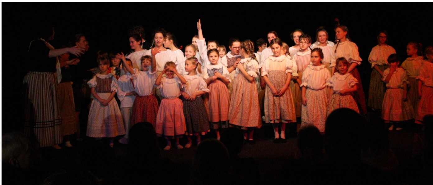
Závěr představení v Jesličkách se líbil divákům i účinkujícím, kteří dostali výborné peciválky.

Ve středu 14. prosince naladili muzikanti Malé velké muziky nejen nástroje, ale i diváky Jesliček vánoční atmosférou. Program zahájili ti nejmladší svojí premiérou v nových krojích. Následovalo mnoho dalších výstupů tanečníků i muzikantů. Nakonec jsme napočítali, že se na pódiu vystřídal na osmdesát dětí. Byly výborné, pobavily publikum a bylo vidět, že i sebe. Tancování a zpívání je zkrátka moc baví. Na konci představení je čekala i sladká odměna. Všichni dostali makové peciválky.