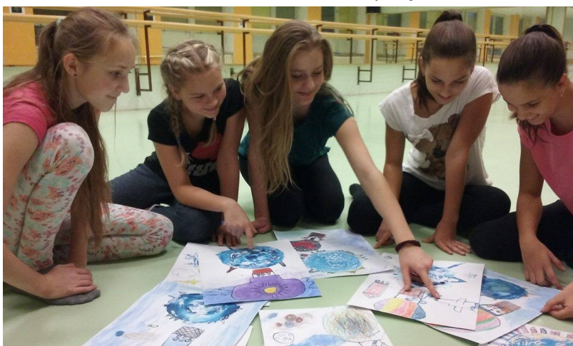
Výběr obrázku na plakát, který bude na představení lákat, je důležitý.