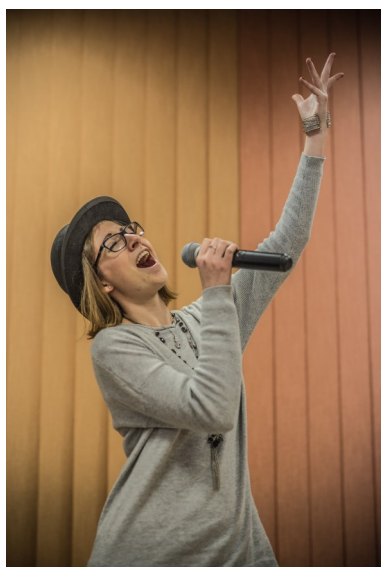
Tereza Česáková - zpěv v populární hudbě