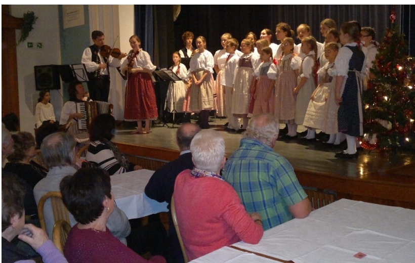
Folklorní soubor Peciválek ZUŠ Střezina potěšil seniory ze Smiřic.