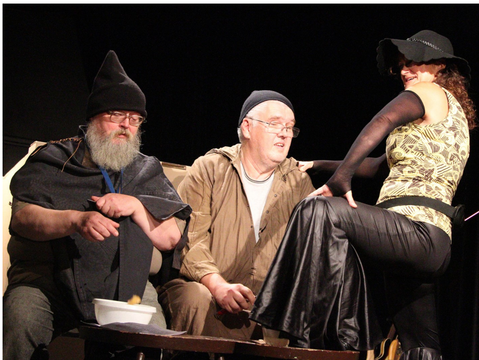
Křemílek a Vochoomůrka to neměli jednoduché. Obzvlášť, když se vydali na cestu manželského soužití. Jan Dvořák ve svém kousku nastínil, jaký byl vývoj situace, na jejímž konci jsou oba skřítkové opět svobodní. Jednoduché to nebylo.