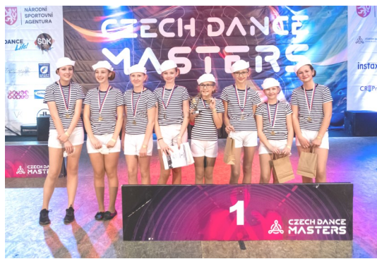
Skupina juniorských začátečnic na pohárové Hobby soutěži.