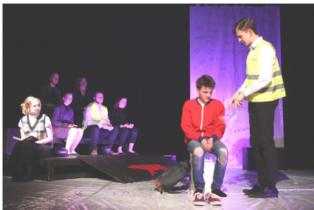
Podivný případ se psem

Letošní jesličkovské jaro patří na stupnici tajfunů k těm nejběsilejším. Doufali jsme, že budeme v plné míře využívat prostory po odstěhovavším se výtvarném oboru. Žel, stavební práce se protáhly a dvě nové velké učebny a komorní víceúčelový sál budeme smět využívat až od září. A tak se v Jesličkách zkouší od rána do večera sedm dní v týdnu. Premiéra stíhá premiéru (nedejbože, aby si někdo něco zlomil, nebo onemocněl – nejsou termíny), jsou dny, kdy se