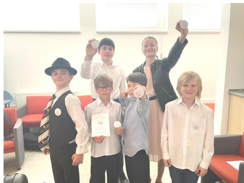
Soubor Trombon trio a Trombon quartet