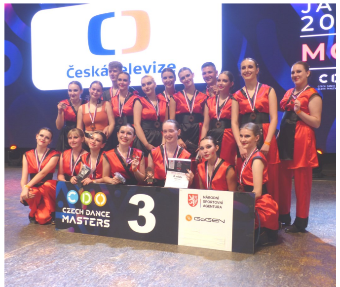
Formace Trip to Japan - druží vicemistři ČR ve formacích adults I.