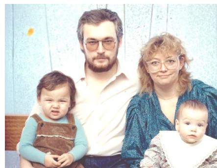
Moje „první“ rodina z roku 1990