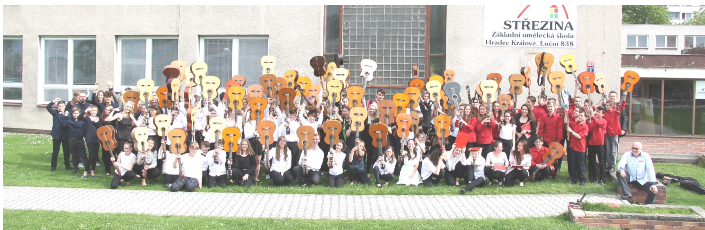
Hradecké Guitarreando 2019