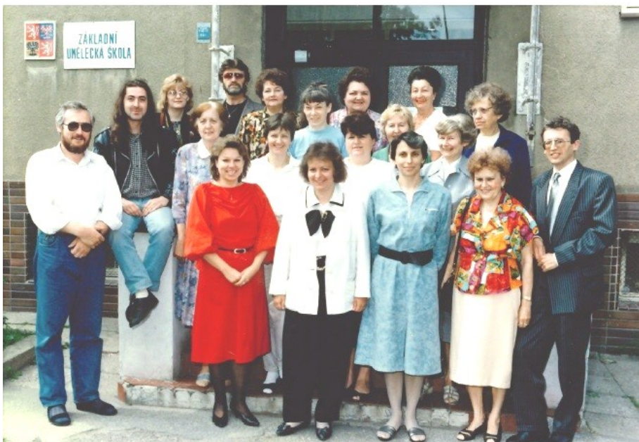
Moje „druhá“ rodina“ ze září 1992 - kolektiv učitelů ZUŠ Na Střežině. Foto nahoře - učitelé nehudbních oborů v Jeslíčkách, dole - hudební obor před starou budovou.