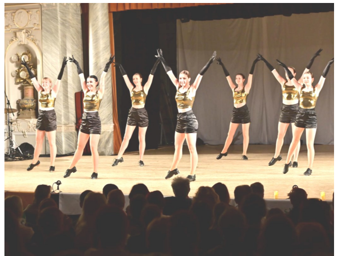
Skupina Dark Academia na festivalu v Plzni